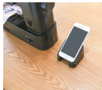
<針カバーはスマホスタンドに>