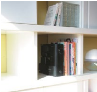
<棚にもスタイリッシュに収納>