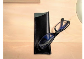
革雑貨(眼鏡ケース)