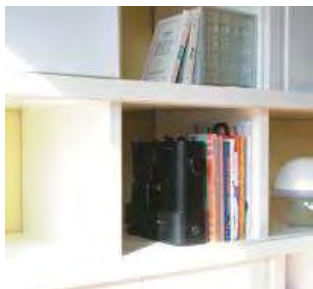
<棚にもスタイリッシュに収納>