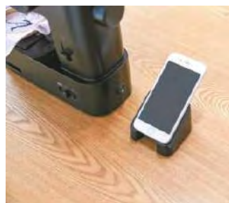
<針カバーはスマホスタンドに>